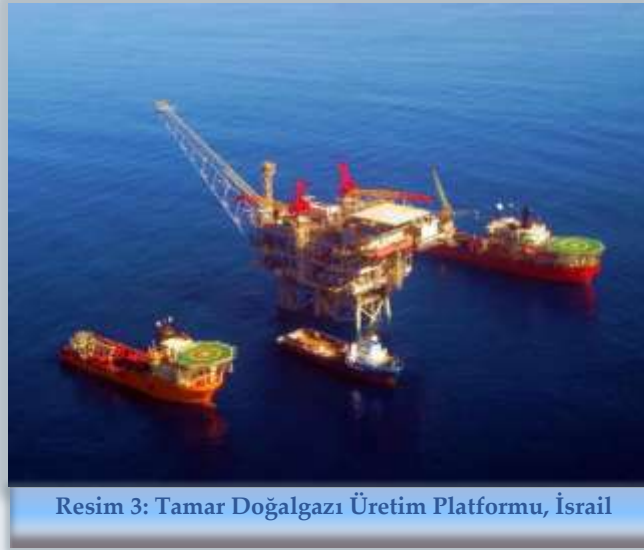
Resim 3: Tamar Doğalgazı Üretim Platformu, İsrail

bir doğalgaz ihracatçısı yapacaktır. İsrail, karasularında keşfedilen diğer doğalgaz yatakları da eklendiğinde ekonomi içi kullanımdan fazlasını ihraç etmek istemektedir. Bu gelişme, İsrail'in önemli bir hedefi olan AB ile ekonomik olarak daha gelişmiş bağlar kurulmasını olanaklı hale getirmektedir. Bu durum iki noktada önem arz ediyor. Birincisi İsrail toplumunun değerlerinden biri olan Avrupa ile yakın ilişkiler kurabilmektir. İkincisi ise İsrail'in ekonomik çıkarları göz önüne alındığında Avrupa İsrail'e en yakın pazar konumunda bulunmaktadır.